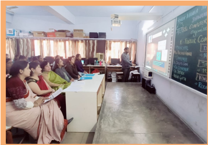
E-Poster Making Competition