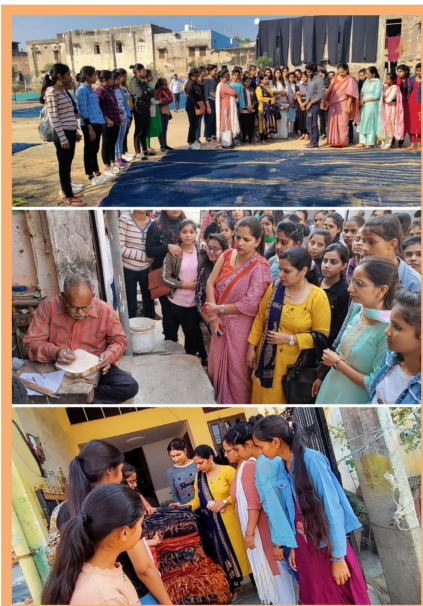
Educational Trip to 'Jaipur'