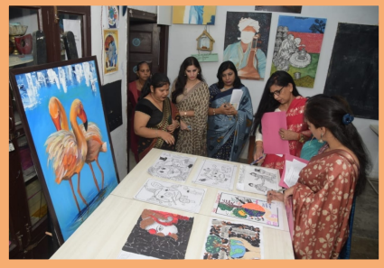
Talent Show Competition

प्रतिभा खोज प्रतियोगिता के दौरान ललित कला विभाग में अपनी कलाओं का प्रदर्शन करती छात्राएं