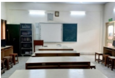
B.Com -Lab I