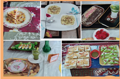
Cooking Without Fire