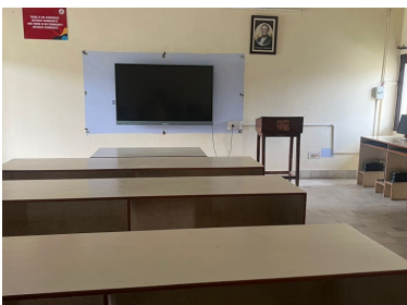
B.Com - Lab II