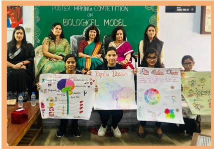
Poster Making Competition on 'Biological Model'