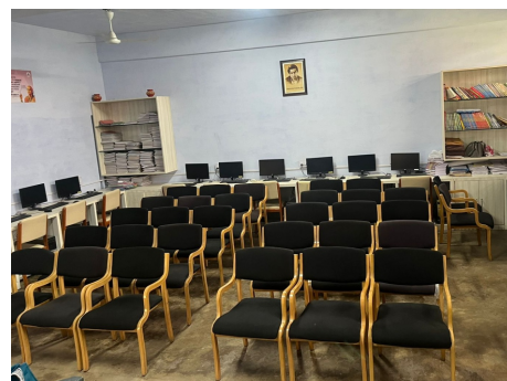
Maths - Lab

Our college has Four labs which are Wifi enabled. Practicals are conducted over here and teachers take practical classes as well. The labs are well equipped with printers and scanners . The labs are sufficient for all the courses. The labs are well maintained which helps in conducting the practicals smoothly, hence enabling our students to understand more about the modern technology.