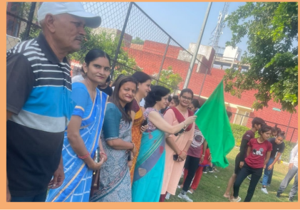
Programme of 'Fit India Freedom India'