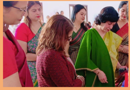
Project work on 'Archaeological Sources of history'