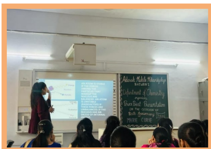
Power Point Presentation